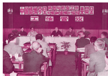
中国造纸学会科普与教育工作委员会与《纸和造纸》编辑委员会1986年在浙江嘉兴召开工作会议

办刊30年来,编辑工作遇到了不少困难,但在以办刊三方为主组成的编委会领导下,通过主