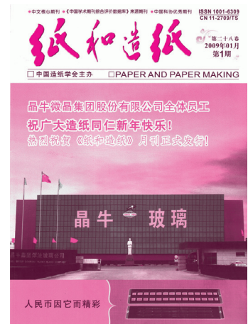
2009年《纸和造纸》改月刊

30年的人生已步入中年,但对于一个刊物来说,它仍然很年轻。它必须紧紧跟上飞速发展的时代步伐,永无止境地学习、创新和进步。如果说过去的30年我们在工作上取得了一些成绩,那么它只能作为今后迈步前进的新起点,决不能作为工作满足的资本。今年是“十二五”规划承上启下的重要一年,国家将加快推进经济发展方式转变、经济结构调整和产业升级,造纸工业在转、调、升过程中,将大力开展自主创新、技术改造、兼并重组、节能减排、环境保护等重要工作。《纸和造纸》作为造纸行业的科技期刊,全国中文核心期刊,必须以科学发展观为指导,坚持办刊宗旨,与时俱进,不断创新,优化办刊内容与形式,面向行业发展和科技进步,面向读者,使本刊内容更丰富,更具科学性、可读性和实用性。在办刊过程中,还需要增强同行业科研、生产、教育等单位 and 读者、作者之间的联系,团结和依靠专家学者,群策群力,努力把期刊办得更好,在我国造纸工业转、调、升过程中力争作出新的更大贡献。