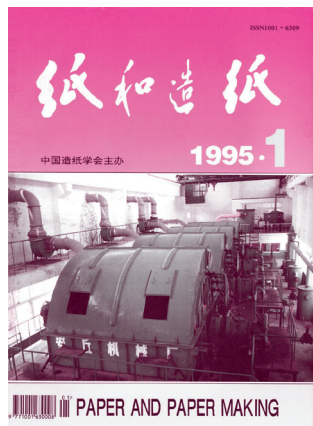
1995年《纸和造纸》改双月刊

2008年5月12日四川汶川发生特大地震后,很多朋友对距离地震中心近在咫尺的我部工作人员的安危十分关心,纷纷打电话、发短信询问。但由于编辑广告发行部办公室遭到严重破坏,都江堰的电信全部中断,信息几天不通,许多朋友忧心如焚,