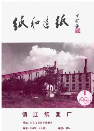
著名书法家李半黎为本刊题写的刊名